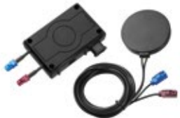
Module GPRS Interlock® 7000