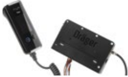
Combiné et Centrale Interlock® 7000