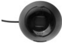
Caméra Interlock® 7000